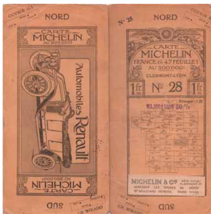
Carte Michelin au 200 000 ème dans leurs versions de couverture les plus connues, avec les publicités pour Renault, sur celle de droite l'étiquette Michelin recouvre l'adresse de l'éditeur Delagrave et on aperçoit le tampon avec la majoration de 50%.