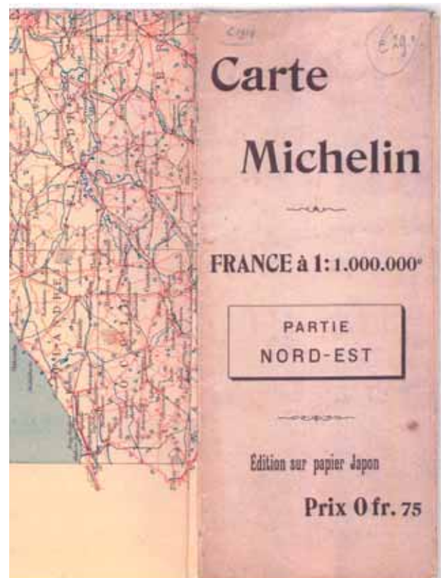
Carte Michelin de la France en 4 feuilles parue à partir de 1908

André Michelin après des études à l'école centrale de PARIS vers 1877 avait travaillé pendant son service militaire au Ministère de l'intérieur, au service de la carte au 100 000 ème .