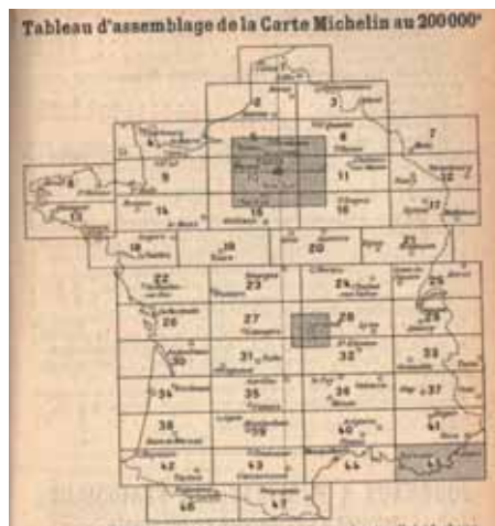
Tableaux d'assemblage parus dans les guides rouge Michelin 1909 et 1912

En 1907 dans le guide rouge est publié une carte de France au 1/1 000 000ème, présentée sous forme d'atlas, 56 pages, chaque page présentant 160x160km, c'est une des premières réalisations du service cartographique Michelin, auparavant les cartes parues dans les guides étaient issues directement des cartes du ministère de l'intérieur. Cette édition 1907 comprenait aussi une série de pages d'une cartes d'Auvergne, au 400 000ème. Une carte des Environs de Clermont est parue en 1907, à titre d'essais et offerte gratuitement localement.