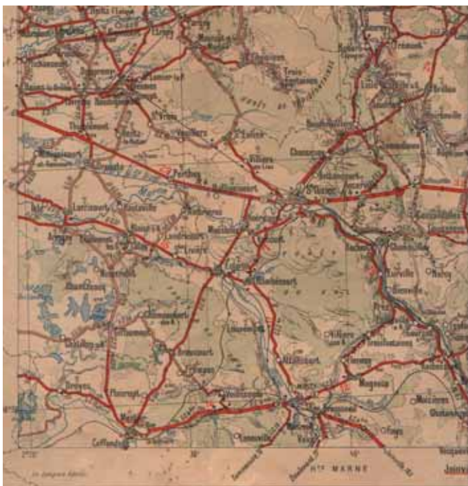
Extrait d'une carte Michelin au 200 000 ème