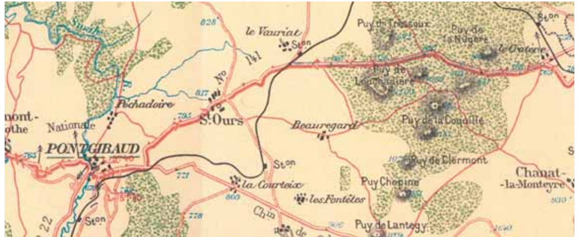
Extrait de la carte au 100 000 ème éditée par Michelin à l'occasion de la coupe Gordon Bennett 1905

Il est difficile de donner une date précise pour les premières cartes routières, suivant les pays leur apparition se situe entre 1880 et 1895, elles résultent du besoin d'information des nouveaux voyageurs. Le nom carte routière préexistait pour certaines cartes des routes, mais ici nous parlons de cartes destinées aux automobiles ou vélos avec des infos spécifiques.