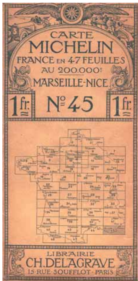
Carte Michelin N°45 Marseille Nice au 200 000ème éditée en 1909 sur cette première série le dessin occupe toute la couverture.

C'est probablement ce savoir-faire qui des années plus tard lui a permis d'imaginer et de mettre en place la cartographie, comme nouvel axe de développement pour sa société, contrairement aux guides et à l'exception de la première de ses cartes, elles seront payantes.